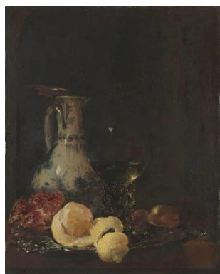
Willem Kalf Stilleben mit Porzellankanne, 1653 Eichenholz, 44,9 x 35,7 cm