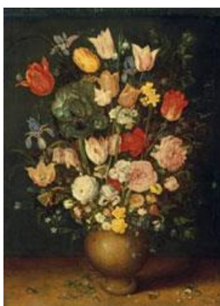
Werkstatt Jan Brueghel d.Ä. Blumenstrauß in einer Tonvase, Beginn 17. Jh. Öl auf Eichenholz, 70 x 52 cm

Die Bayerischen Staatsgemäldesammlungen restituieren das Gemälde „Blumenstrauß in einer Tonvase“ aus der Werkstatt Jan Brueghel d. Ä. an die Erben des Wiener Kaufmanns Julius Kien.