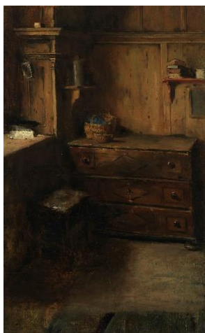
Ernst Immanuel Müller Bauernstube (Studie), vor 1915 Öl auf Leinwand, 66,8 x 42,3 cm

Die Bayerischen Staatsgemäldesammlungen restituieren nach proaktiver Recherche 2017/18 ein Werk von Ernst Immanuel Müller an die Erbgemeinschaft nach Ludwig Friedmann (30.10.1880-07.03.1943).