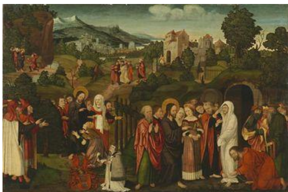
Süddeutscher Meister Die Auferweckung des Lazarus, um 1530/40 Tannenholz ( Abies alba ), 107 x 160 cm